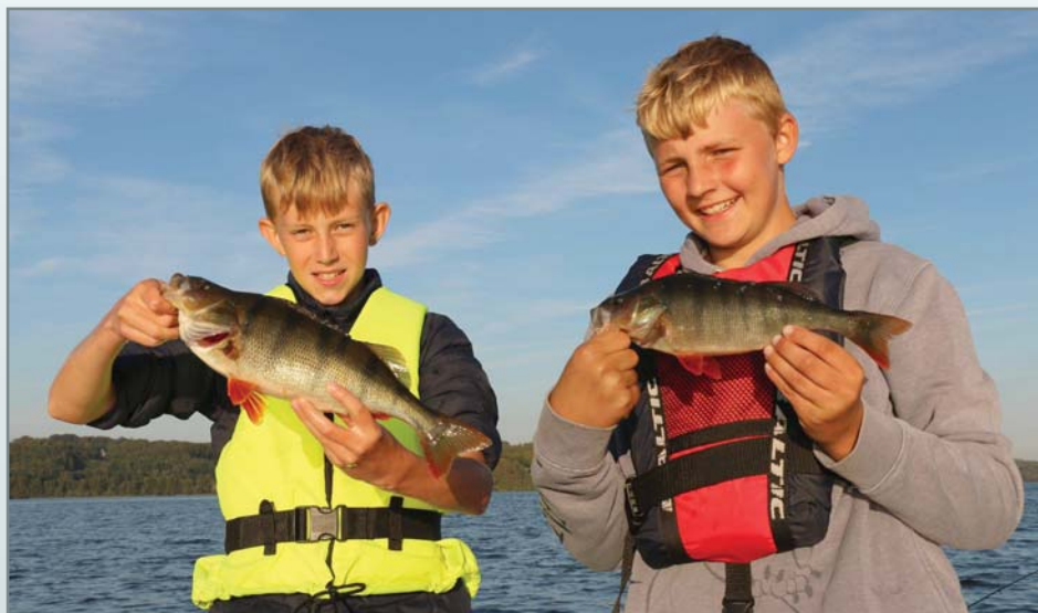
To juniorer med aborre

Lad os kigge væk fra vores nederlag til Skanderborg og kigge mere i retning af de små sejre. For første gang i mange år, oplevede klubben fremgang i de kvindelige medlemmer og ud af ingenting stod vi på en klubaften, med 4 piger og en gruppe drenge. Da sæsonen startede og vi havde ingen piger i klubben, tror jeg ikke nogen havde gættet, at vi pludselig ville stå i den situation. Det viser bare at fiskeri er for alle og uden at tale dem op, så gjorde de det mega godt.