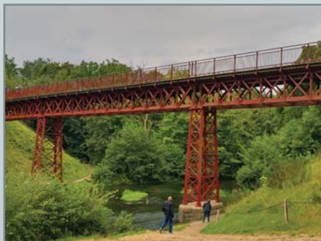
Den Genfundne bro ved Vestbirk