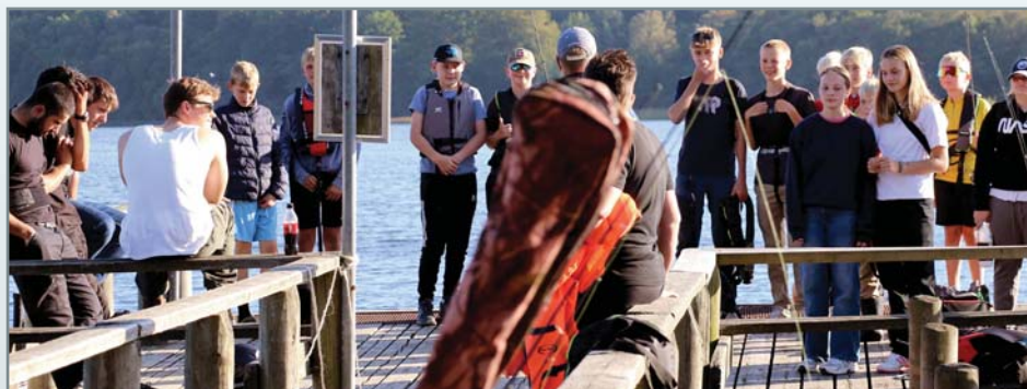
Aborretur på Julsø

Der var kæmpe opbakning til turen og i sidste sekund, måtte vi ud og have fat i flere folk, der kunne lægge både til, så vi kunne have alle mand med. Vi endte med at være 8 både afsted, og næsten alle juniorerne fik fisk.