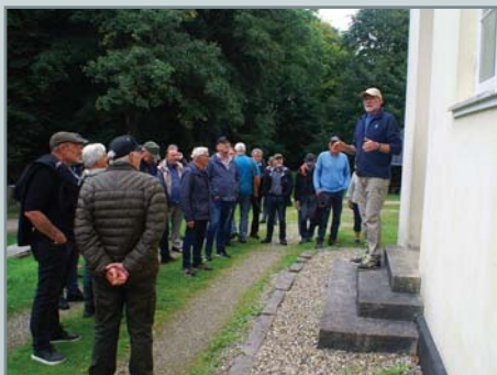
Ved Vestbirk kraftværk