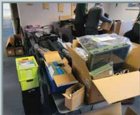
Besøg af en fiskegrejsforhandler