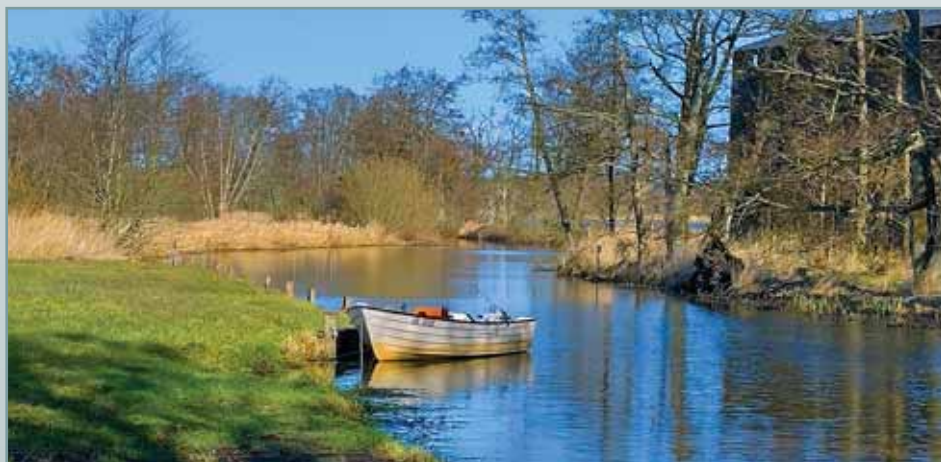
En af foreningens både på "udflugt" til Klostermølle

Så lige en påmindelse: Tag aldrig en båd, du ikke har booket. Tag aldrig en trailer, du ikke har booket. Der har desværre været et par eksempler i år, men vi ved jo, alle laver en fejl på et tidspunkt. Ellers går det jo ufatteligt godt. Til sidst er kun at sige, tak for det gode samarbejde, der har været i løbet af året, som vi håber vil gentage sig i 2023, så god vind i sejlene.