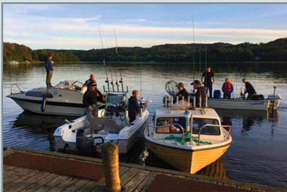
Klubtur fra 2020, hvor bådene var på vej ud

Er du interesseret i at blive en del af juniorklubben, så kan man altid tage kontakt til os, over vores Facebook side “Silkeborg Fiskeriforening Juniorklub” .