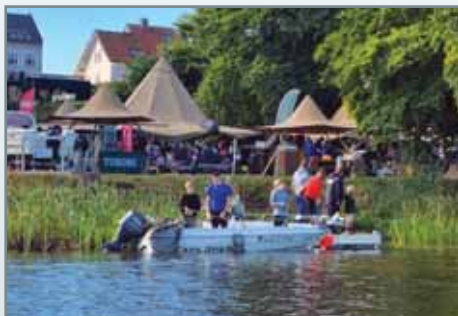
Nogle af de unge valgte at fiske fra båd

Som medhjælper til konkurrencen, blev man også sat til at hjælpe ungerne med at fiske. Vi kunne ikke garantere man fangede noget. (Rygterne går dog på vi gjorde et godt forsøg). Medhjælpere var igennem konkurrencen synlige med de blå trøjer, med foreningens logo. På den måde vidste alle, hvor man kunne få hjælp.